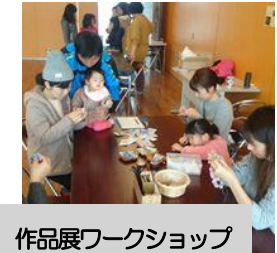
作品展ワークショップ