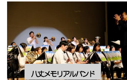
八丈メモリアルバンド