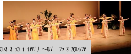
加オオカイパナ〜ガ〜万オカニワ