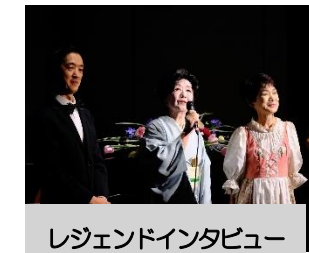
レジェンドインタビュー