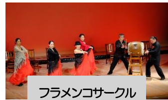
フラメンコサークル