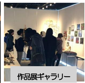
作品展ギャラリー