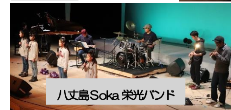
八丈島Soka 栄光バンド